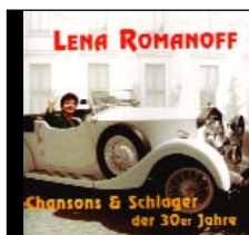
Chansons & Schlager der 30er Jahre