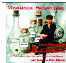
Musikalische Hausapotheke Lieder von E. Kästner