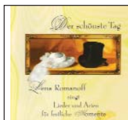
Der schönste Tag Lieder und Arien für festliche Momente