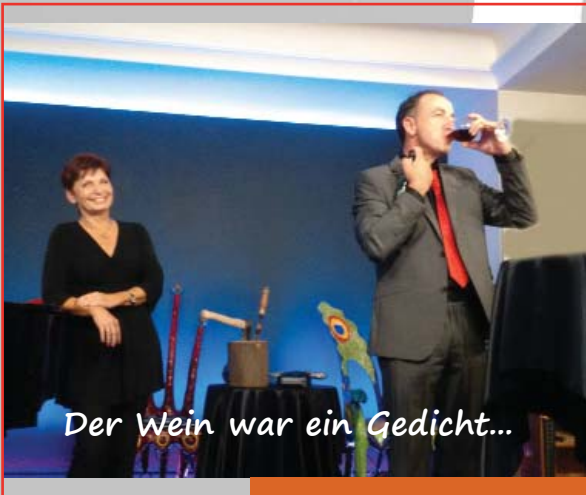
Der Wein war ein Gedicht...