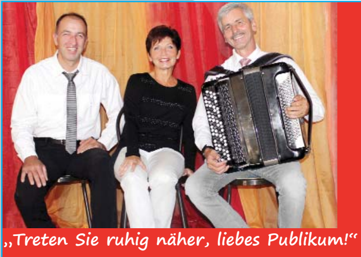
„Treten Sie ruhig näher, liebes Publikum!“