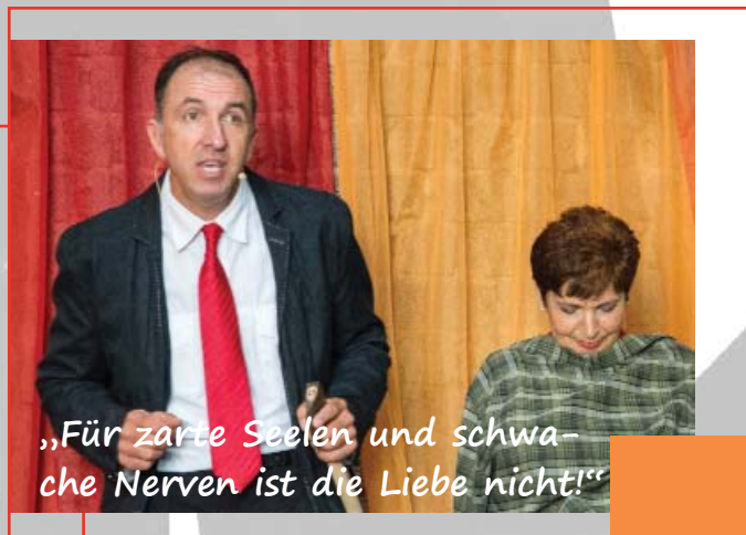
„Für zarte Seelen und schwache Nerven ist die Liebe nicht!“

von Heinz Erhardt Otto Reutter Hugo Wiener Reinhard Mey Kurt Weil Erich Kästner Bodo Wartke u.a.