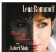
Lieder & Chansons von Robert Stolz